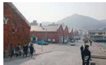
金森赤レンガ倉庫他

参加者の皆様には本当にお忙しい中参加していただきまして、有意義な研修会にさせていただきましたこと心から御礼申し上げます。