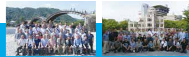
岩国市の錦帯橋にて