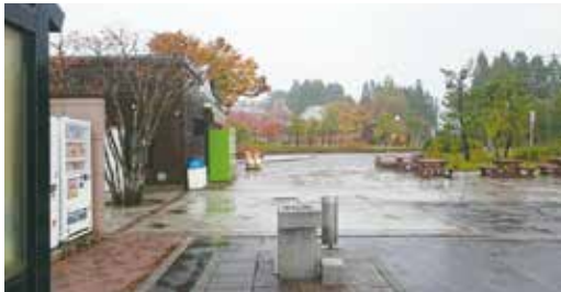
日本最初の観想女子修道院