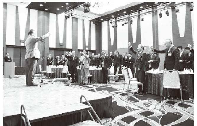
▲5.22 平成30年度 第16回定時総会 (ホテルメトロポリタン山形)