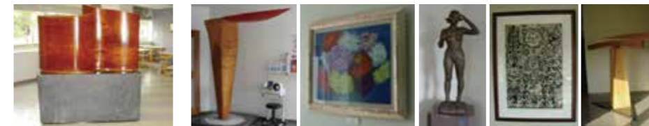
1階ロビー 空に架ける階段 富樫実作