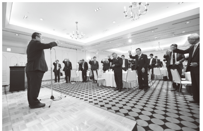
▲令和元.5.23 平成31年度 第17回定時総会(ホテルメトロポリタン山形)