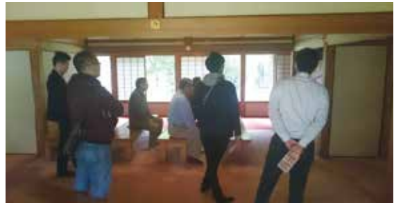
世界遺産 富岡製糸場