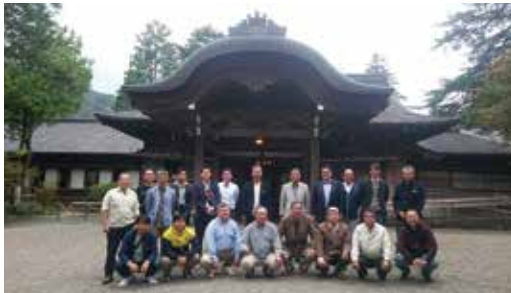
日光田母沢御用邸