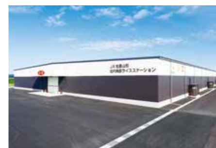
JA全農山形 庄内南部ライスステーション