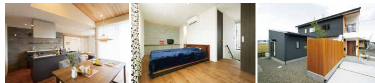
▶ 太白区に建つ庭風の家 ◀