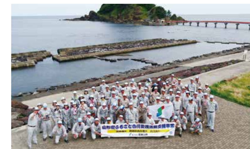
由良海岸の清掃ボランティア

不可欠ですが、自然を破壊する側面があることも事実です。そこでこの地域に於ける総合建設業のリーディングカンパニーとして自然との調和に根ざしたまちづくり、インフラ整備を展開し誰もが愛情をもってふるさとと呼べる地域社会を創造していきます。そして地域発展に貢献する企業としてお客様や社会から信頼される企業で有り続けたいと考えます。