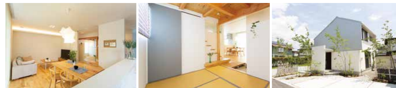
▶ TRETTIO GRAD ◀