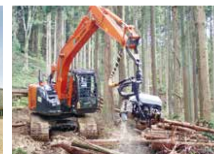
林業造材作業(ハーベスタ)

不可欠ですが、自然を破壊する側面があることも事実です。そこでこの地域に於ける総合建設業のリーディングカンパニーとして自然との調和に根ざしたまちづくり、インフラ整備を展開し誰もが愛情をもってふるさとと呼べる地域社会を創造していきます。そして地域発展に貢献する企業としてお客様や社会から信頼される企業で有り続けたいと考えます。