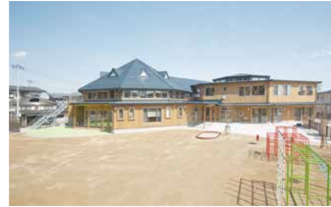
寒河江市立なか保育所