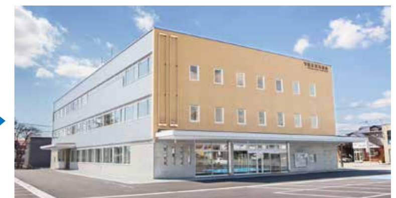
尾花沢市役所(平成31年 弊社JV施工)