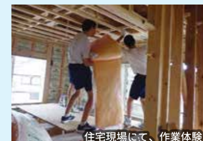
住宅現場にて、作業体験