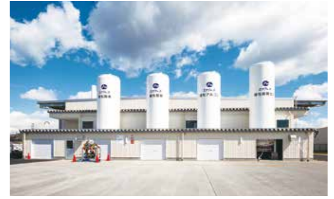
山形液酸(株)VSU充填所建設工事