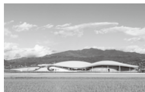
シェルターインクルーシブプレイスコバル(山形市)