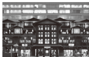
ミナカ小田原(神奈川県)