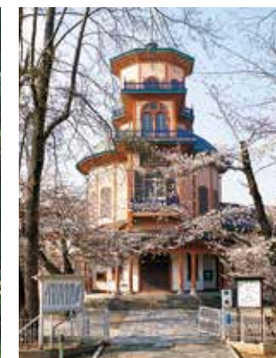
重要文化財旧済生館病院復元工事