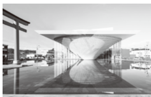
静岡県富士山世界遺産センター(静岡県)