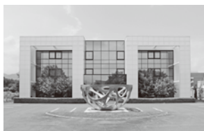
株式会社シェルター本社(山形市)

地球規模の気候変動への解決策として、また、人々が心身ともに豊かに暮らすことができる環境をつくるため、木造建築によって「都市(まち)に森をつくる」事業を推進します。これまでの枠組みにとらわれず、時代の変化に対応して社会から求められる役割を果たし、私たちの目指す「木造都市」の実現に向けて邁進します。