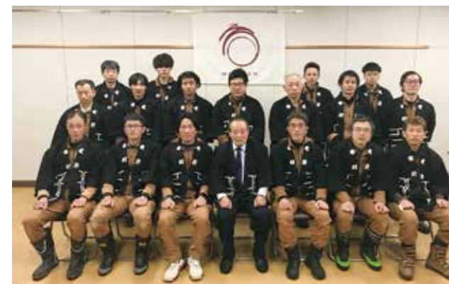
技術部大工集団18名