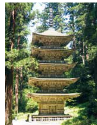
国宝 羽黒山五重塔修復工事