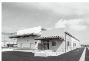
山形広域炊飯施設(山形市)

〒990-0401 山形県東村山郡中山町大字 長崎字中原1245-1 TEL.023-682-2198 FAX.023-662-4710