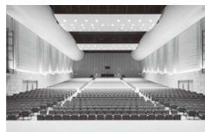
シェルターなんようホール(南陽市)