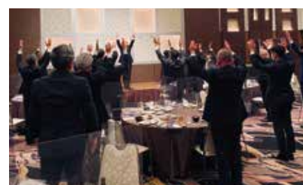
原行雄山形県建築士事務所協会 懇親会手締め