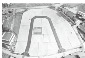
落合町小河向地内宅地造成(山形市)