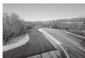
本沢川河川災害復旧(山形市)